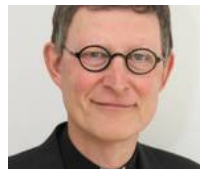
Ein Bild, wie ihn viele kennen